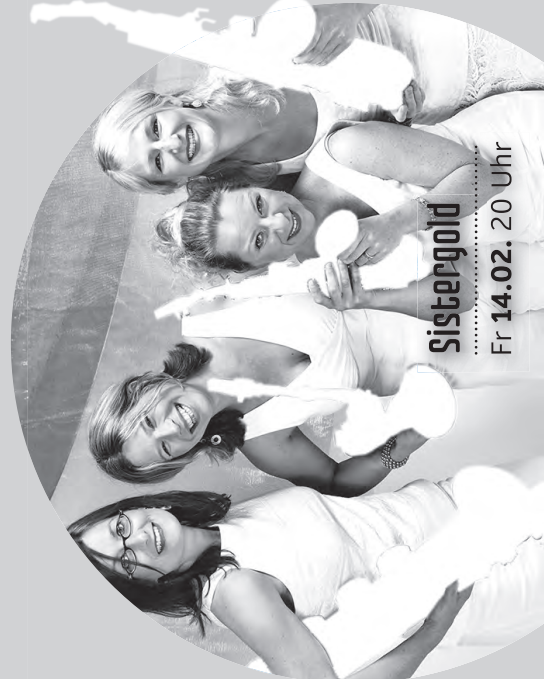
Sistergold Fr 14.02. 20 Uhr